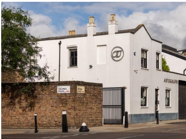
Der Hauptsitz von Autograph im Norden Londons

London, 6. Dezember 2021 – Die „Geisterlichter“ verschwinden allmählich aus den Londoner Theatern, während die Welt lernt, mit COVID-19 zu leben. Eine nach der anderen kehren die bekannten Shows zurück, die so viel Freude, Farbe und Einnahmen in die lebendigste Theaterszene der Welt bringen. Dabei steht die Drahtlostechnologie von Sennheiser im Mittelpunkt: Hamilton, Les Misérables, Das Phantom der Oper und Disneys neueste Produktion Frozen sind nur einige der Shows, die derzeit auf die Digital 6000 Drahtlossysteme von Sennheiser setzen.